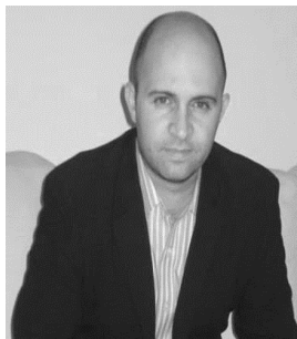
Νάσιος Ορεινός Εκλογικός Αναλυτής

Η απαγκίστρωση, αλλιώς αποσυσπείρωση των ψηφοφόρων από τα κόμματα, αναλυτές την έχουν ονομάσει «επανάσταση του εκλογικού σώματος», αποτελεί το κύριο χαρακτηριστικό των κυπριακών προεδρικών εκλογών του 2023. Οι αριθμοί είναι χαρακτηριστικοί και καταδεικνύουν ότι η τάση αυτή είναι ανοδική τα τελευταία χρόνια. Στις Βουλευτικές εκλογές του 2011 ο αριθμός των ψηφοφόρων που ψήφισαν «Άλλο» κόμμα και το οποίο δεν είχε εισέλθει στη βουλή είχε καταγραφεί μόλις σε 4823, ποσοστό 1,19%. Το 2016 ο αριθμός αυτός έγινε 11.217, ποσοστό 3,18% και το 2021 σκαρφάλωσε στους 52.205 εκλογείς, ποσοστό 14,6%. Ιδιαίτερα, θα πρέπει να αναδειχθεί ότι η Κυπριακή βουλή αυτή τη στιγμή αντιπροσωπεύεται μόνο με το 55% του εκλογικού σώματος. Συγκεκριμένα, 305.507 ψήφοι κομμάτων που εισήλθαν επι συνόλου του εκλογικού σώματος 557.836. Το υπόλοιπο 45% (252329 ψήφοι) είτε δεν πήγε είτε έλαβε κάτω του εκλογικού μέτρου (3,6%). Αυτό σημαίνει ότι μια σημαντική μερίδα του εκλογικού σώματος έχει κινηθεί ανεξάρτητα από τους σχεδιασμούς των κομμάτων και γενικά δεν έχει ακολουθήσει τις προτροπές αυτών, ενώ υπάρχει και μια μερίδα η οποία συστηματικά δεν πάει στην κάλπη.