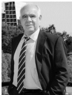
Ανδρέας Θεοφάνους Καθηγητής Οικονομικών και Δημόσιας Πολιτικής Πρόεδρος του Κυπριακού Κέντρου Ευρωπαϊκών και Διεθνών Υποθέσεων καθώς και του Τμήματος Πολιτικών Επιστημών και Διακυβέρνησης του Πανεπιστημίου Λευκωσίας